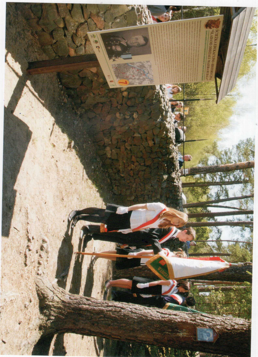
69 rocznica bohaterkiej śmierci mjr. Hubala w Anielinie - Młodzieżowy Počet Szlendarowy, na pierwszym planie tablica ścieżki edukacyjno-historycznej wykonanej przez ZNPK w Moszczenicy.