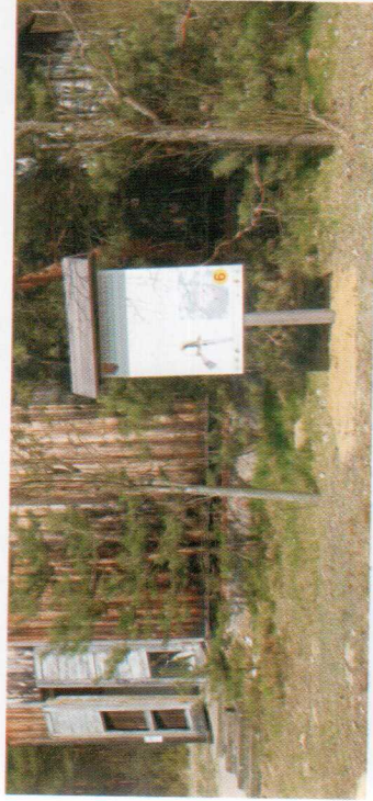
Przystanek nr 6 ścieżki przed starą szkołą w Ponikłach