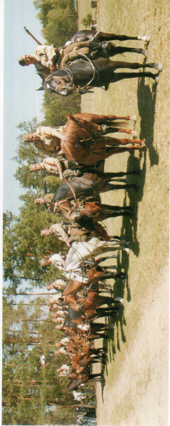
Konna Grupa im. 7 Pulku Ułanów Lubelskich na uroczystościach przy szlancu w Anielinie