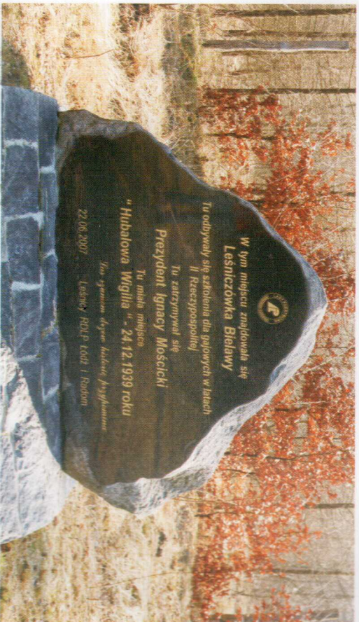
Pamiętkowy kamień na miejscu leśniczówki Bielawy