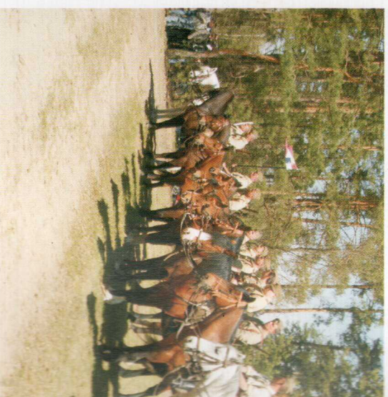
Konna Grupa im. 7 Pułku Ułanów Lubelskich na w