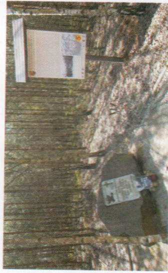
Przystanek nr 5 – Wólka Kuligowska - pomnik Kości