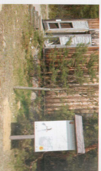
Przystanek nr 6 ścieżki przed starą szkołą w Ponikwie